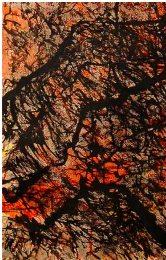
Összetartozók 2011. csiszolt tus | 1,2x0,8 m