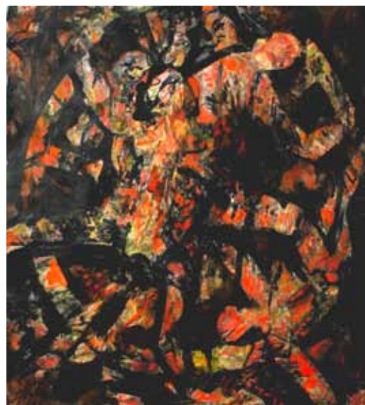
Jelenetek az Isteni színjátékból III. 2005. merített tus | 1,24x1,14 m (Miskolci Galéria Városi Művészeti Múzeum tulajdona)