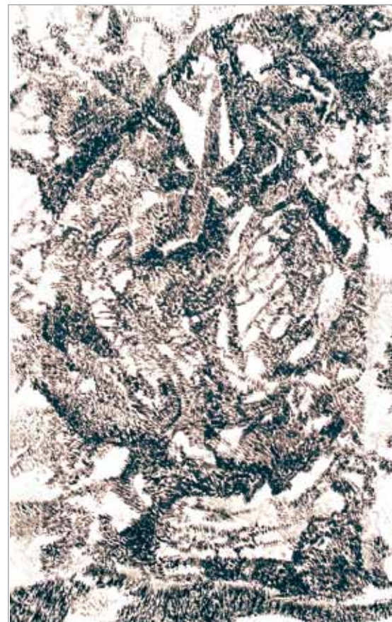
Téli utakon III. 2005. tus és ecset | 1,5x0,9 m