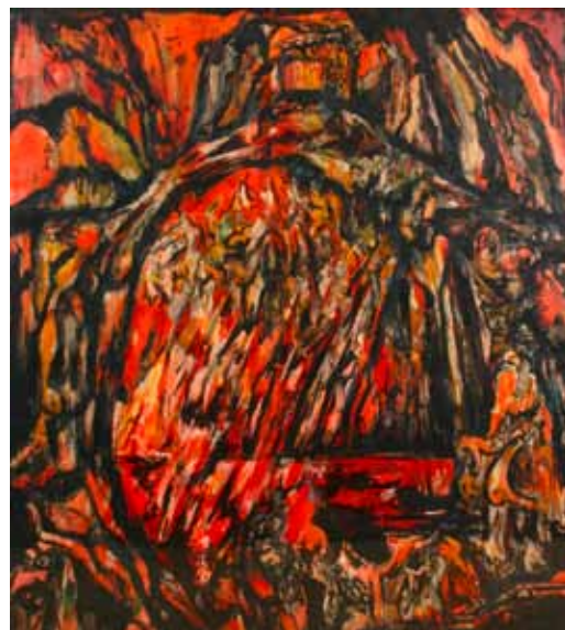
Jelenetek az Isteni színjátékból IV. 2005. merített tus | 1,24x1,14 m (Miskolci Galéria Városi Művészeti Múzeum tulajdona)