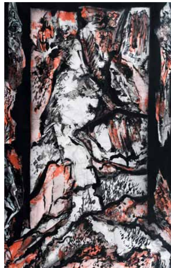
Az ember története I. 2010. merített tus | 1,2x0,8 m